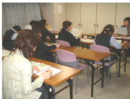
熱心に聞き入る出席者

今年度、コンサルテ瀬田では、あらゆる社会的理不尽な事象から入居者を守ることを重要な課題としています。詐欺まがいの財産運用や、不法な契約、あるいは虐待などによって入居者各位が深刻な被害を受けないようにするには、なんといっても正確な法的知識と信頼できるネットワークが無くてはなりません。成年後見制度はその大切な一環となっています。今後、成年後見制度に関するご相談がございましたら、遠慮なく相談室までお申し付け下さい。