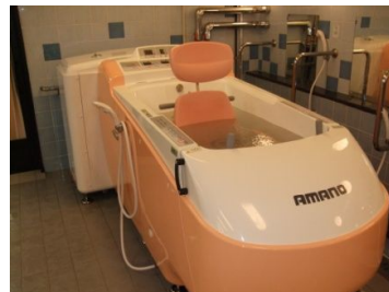
浴槽扉を閉じ椅子を入れ、湯を張る