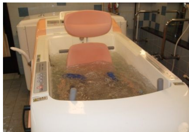
お好みでジャグジーにもなります