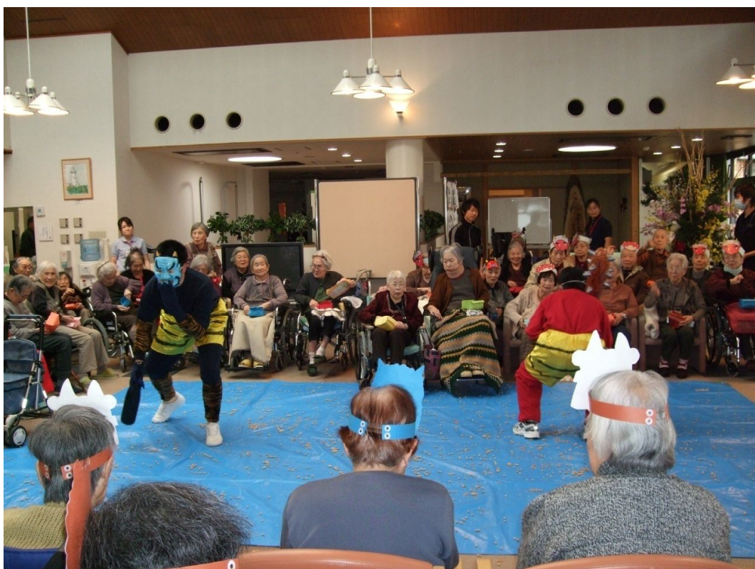
皆さんの手作りの柵から痛い豆が！さしもの鬼も逃げ腰に

節分はもともと、季節の移り変わる時、すなわち立春・立夏・立秋・立冬の前日を意味します。特に立春の前日を言い、この日の夕暮、柵の枝に鰯の頭を刺したものを戸口に立て、鬼打豆という炒った大豆を撒いて、鬼を退散させ福を招く伝統行事です。（岩波：「広辞苑」などから）恒例の2月3日、さわやかホールで豆撒きの行事が行われました。各自手作りの柵に一杯の豆を持ち、登場した赤鬼・青鬼に“鬼は外！”と元気にぶつけて、おおいに盛りあがりました。