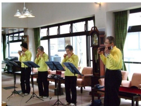
③1月19日(土)ハーモニカ演奏