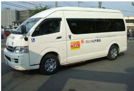
TOYOTA；レジアスエース・ウエルキャブ