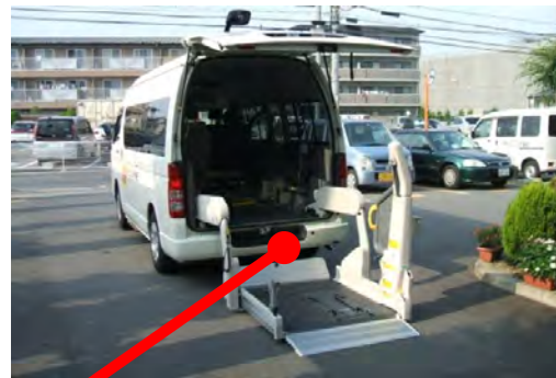
後部に大型電動格納式リフトを装備