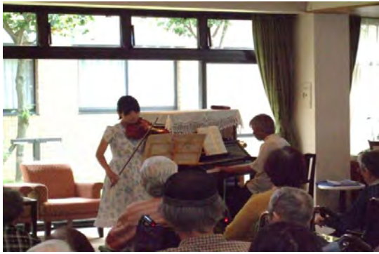
堀氏父子による演奏