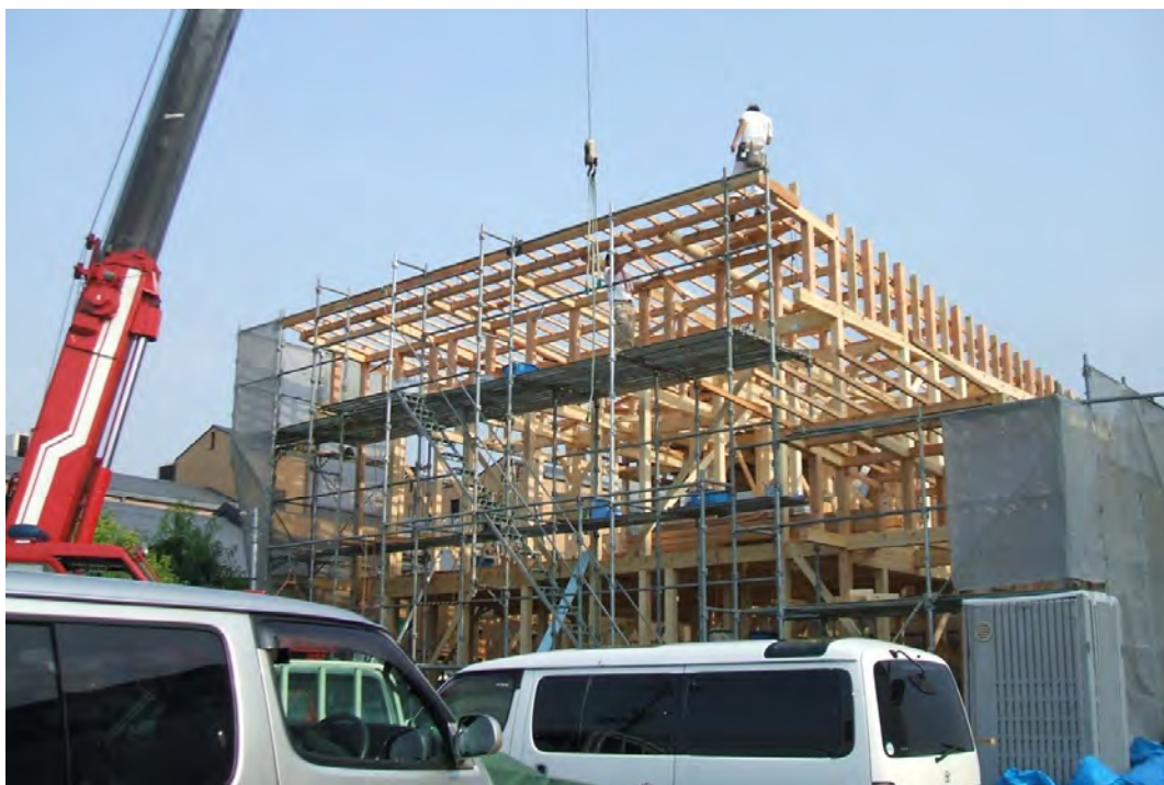
炎天下、急ピッチで行われている移転工事。棟上げが終了しました。