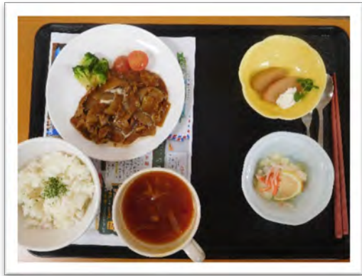
イベント食『ロシア』