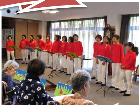
たなかみグリーンエコー様 演奏会