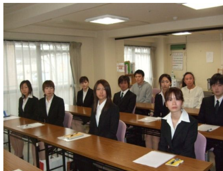
平成22年度新入社員の皆さん