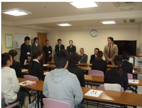
社長、施設長、幹部社員の紹介

平成22年4月1日に平成22年度新入社員の入社式が行われました。お天気が少し良くなかったけれど、希望に満ちた笑顔に包まれてコンサルテ瀬田も終日華やいだ雰囲気でした。全員で11名、笑顔とちょっと不安げな顔、親元を遠く離れて就職した新人もおります、これからも健康に気をつけて入居者様の介護をしていただけるようにと願った一日でした。ご家族様もご来館時、新人に声を掛けていただけたら幸いです。今後とも宜しくご指導下さい。