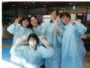
お餅つきのスタッフ