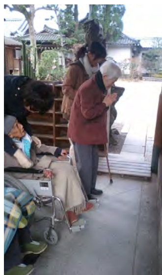
2日、3日 建部大社に初詣