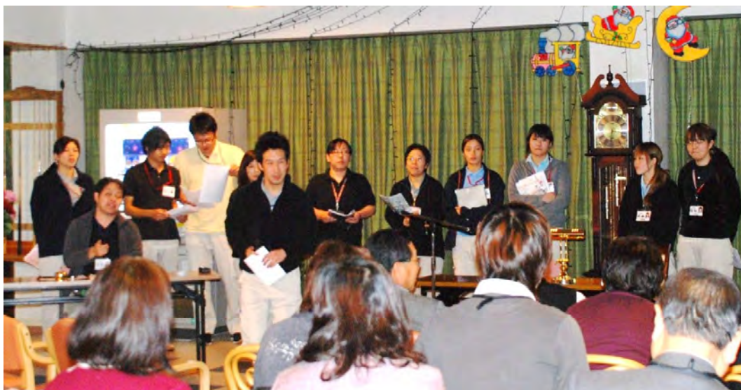
平成21年12月17日「事例発表研修会」の発表風景

入居者のみなさま、ご家族のみなさま、明けましておめでとうございます。昨年はコンサルテ瀬田の運営に関しまして、色々ご指導、ご支援を賜りまして本当に有難うございました。コンサルテ瀬田は本年は元旦の書き初め、二日、三日の建部大社の初詣、そして恒例の三日の大茶会で幕を開けました。毎年元旦に入居者様にご挨拶をさせていただいておりますがお正月の皆様のお顔は輝いておられます。