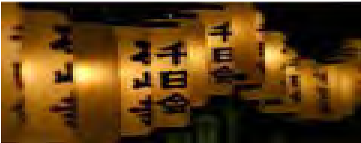
幻想的な石山寺の千日会

石山寺 千日会 毎年八月九日 万灯供養の火があがり、この日お参りすると、千日分のご利益あるといわれます。夜には瀬田川を美しく彩る花火が見ものです。打ち上げ数は、約1,000発です。開始時間は20時30分から21時まで。石山寺は紫式部が「源氏物語」を執筆したと言われる「源氏の間」があります。西国第十三番の札所であり、奈良時代からの最古の歴史と伝統を持つ霊山です。三万六千坪におよぶ広大な境内には、日本唯一の巨大な天然記念物、世界的にも珍しい硅灰石がそびえています。