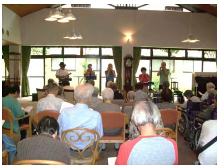
「草津ハーモニカクラブ」の皆様