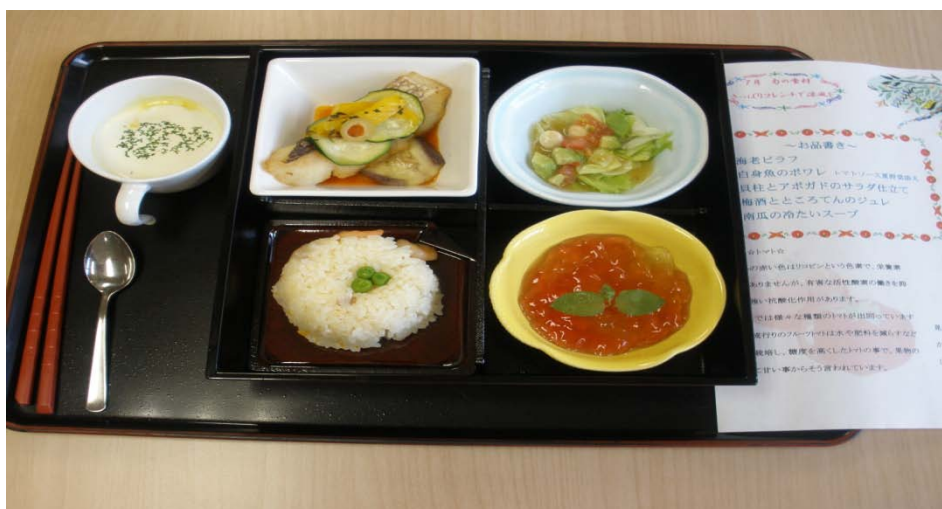
ひめだいの姫鯛のポアレ・夏野菜添え