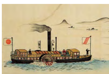
明治2年の「一番丸」の図

広重が描いた「近江八景」の中の「瀬田の夕照」や「石山の秋月」の舞台を、昔懐かしい外輪船「一番丸」から眺める景色は、まるでタイムスリップしたかのような感動を与えてくれます。一周約一時間と少しの乗船です。お時間がありましたら一度いかがでしょうか。