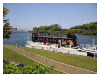
現在就航中の「一番丸」