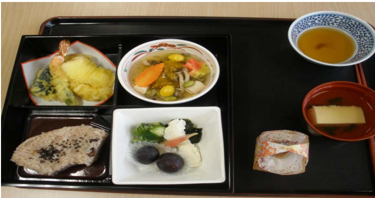
「敬老の日・松花堂弁当」