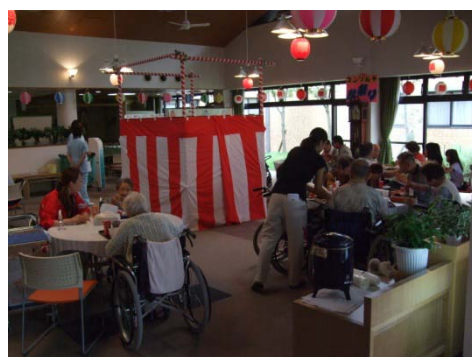
ホール内での昼食会

ちらしずし、おでん、フランクフルトソーセージ、たこ焼きそれと素麺の吸い物が付いています。