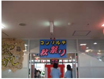
さわやかホール入口