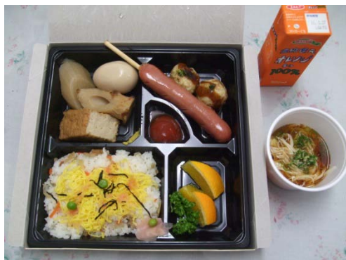
秋祭り特製お弁当

9月23日(木)にコンソルテ瀬田秋祭りが開催されました。当日は前日からの雨が残りあまりよい天気ではなく中庭大テントを使つての昼食会は急遽さわやかホールに移されました。それでもご家族様や近所の保育園児の皆さんにたくさん来ていただき賑やかな一日となりました。秋祭り特製のお弁当の後は、ヨーヨー釣り、綿菓子、宝探しなど楽しんでいただき、さいごは恒例の櫓を囲んでの江州音頭で締めくくりました。