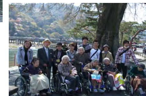
渡月橋を背景に 記念撮影