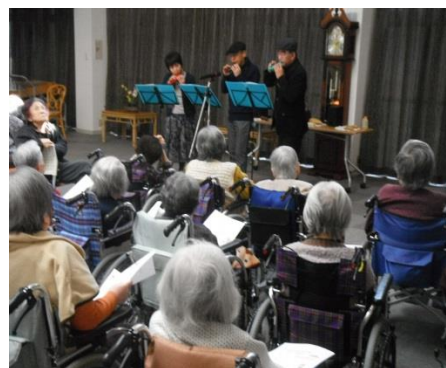
オカリナアンサンブル「SORA」様