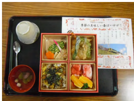
イベント食 : 日本の四季弁当