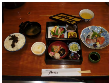
鮎屋の郷 : 懐石