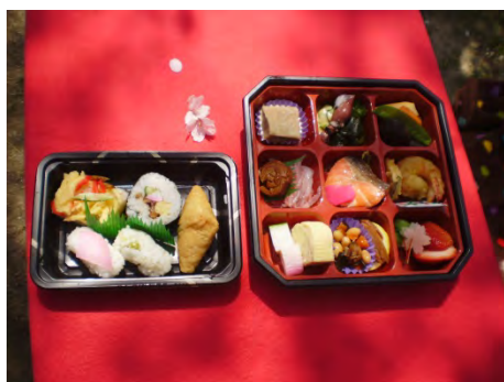
お花見ドライブ特製弁当