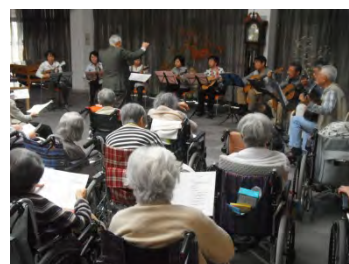
「ラーゴ・マンドリン アンサンブル」様によるマンドリン演奏会