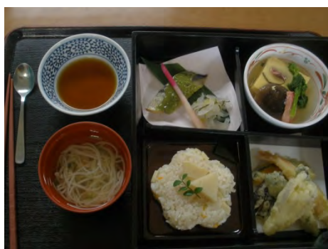
行事食 : 松花堂弁当

(5月は「目に青葉～春の名残弁当～」を予定しております。食材仕入れの都合でメニューの変更もございます、また入居者様の御体調等によりご提供できない場合も御座いますのでご了承ください。)