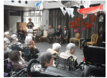
「コンサルテ瀬田音楽会」