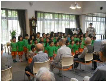
「レイモンド保育園お遊戯会」