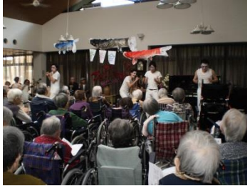
「音楽会：職員パフォーマンス」