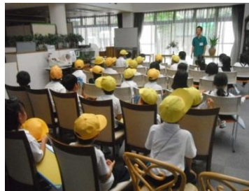
「瀬田小学校：職業講話」