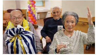
ビンゴゲーム大会